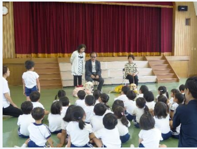
H. 30. 6. 20 明星幼稚園 盲導犬と一緒に遊ぼう