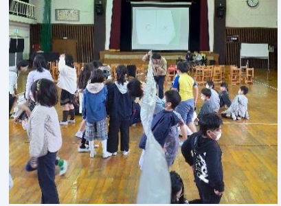
R4. 11. 17 南立石小学校 障がいO×クイズ