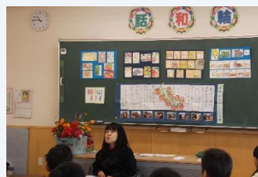
H29. 12. 14 山の手小学校 絵手紙教室