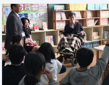
R. 1. 12. 10 緑丘小学校 車いす体験