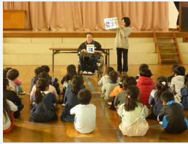
H. 30. 11. 30 大平山小学校 身体障がい学ぶ(車いす体験)