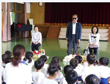
R. 1. 6. 12 明星幼稚園 盲導犬と触れ合おう