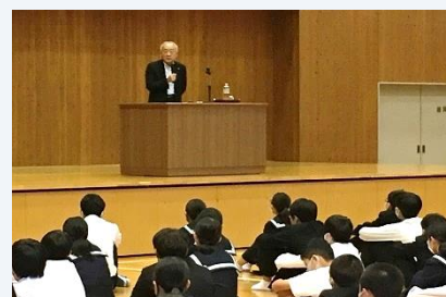
R2. 7. 11 北部中学校 障がいのある人へのいじめや差別について