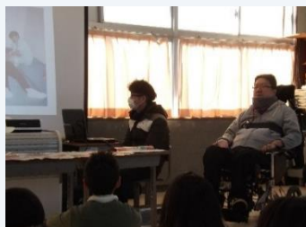
H29. 12. 2 春木川小学校 障がいのある方の人権について