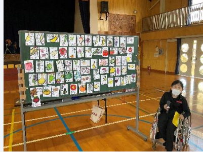
R4. 10. 13 境川小学校 絵手紙を書こう