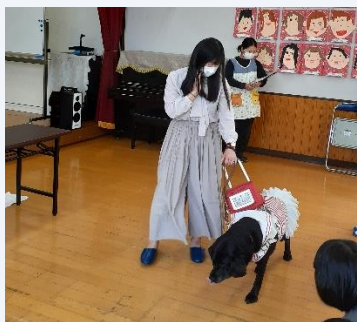
R5. 5. 26 春木川幼稚園 盲導犬との生活について