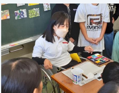
R5. 10. 19 山の手小学校 絵手紙を書こう