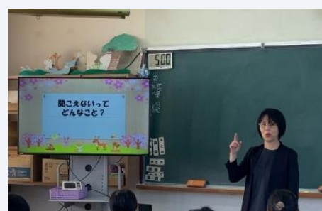
R5. 10. 25 春木川小学校 聞こえない不便、不自由と 感じない社会を目指して