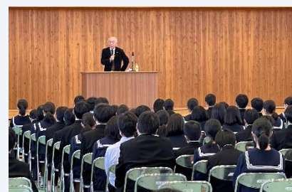
R3. 11. 9 山の手小学校 ユニバーサルデザイン と車いす体験