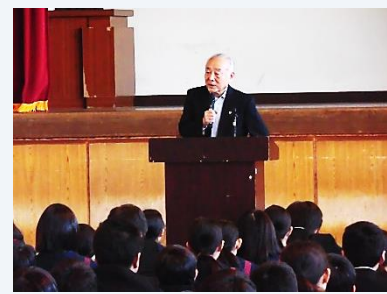
R1. 11. 13 北部中学校 障がいのある人へのいじめ や差別について