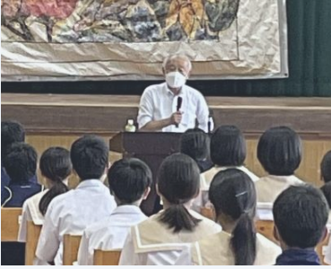
R4. 6. 27 北部中学校 障害がある人のいじめや差別について