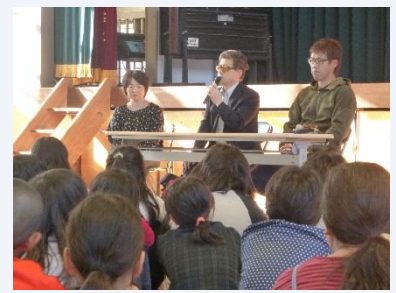
H. 30. 11. 6 石垣小学校 視覚障がいを学ぼう