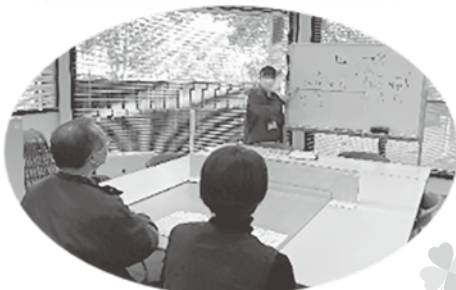
市民の相談に応じ

市民後見人や親族後見人等の各種相談に応じ、必要な専門的助言等のサポートを行います。