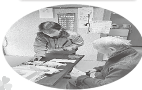
隣りの市民を支えます