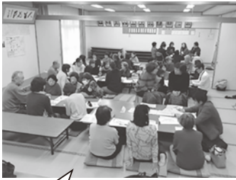
中島公民館でワークショップを行っている様子

地域での福祉力の向上と連携を目的に、民生委員・自治会長と一緒に福祉協力員研修を行っています。自分たちが暮らす地域での生活や福祉、困りごとを「我が事」として受け止め、『学び・見守り・知らせる』活動時の心構えなどについて研修をし、地域での可否確認や見守り支援時の課題を、民生委員に繋げない会話や見守り活動を通して、互いに「つながり」「かかわり」台える地域活動を行っています。