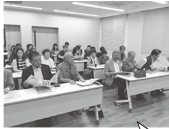
複合福祉施設「八つ星の丘」(宇佐市)訪問、施設職員から説明を受けている様子