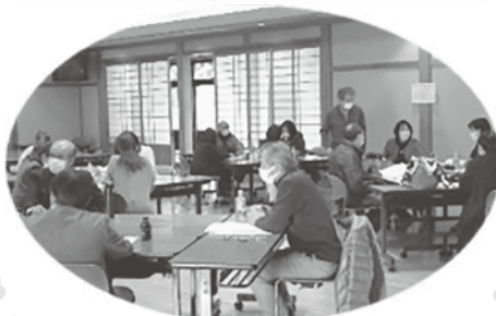
市民が自発的に学び