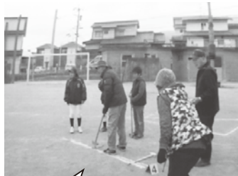
子ども達とグラウンドゴルフをしている様子

地域の子どもの減少したことによる世代間交流の機会の減少や、高齢者の運動不足を解消するため、三世交代流グラウンドゴルフを実施しています。 この活動は地域住民の情報交換や、子供たちの成長を見守る場として20年以上も取り組んでいます。 地域住民が互いに顔見知りになり、気軽にあいさつができる関係を広げていくことで、安全・安心な地域づくりにつながる取り組みになっていますので、今後もみんなが楽しみながら続けていきたいです。