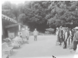
試合の前にはみんな気合が入ります!