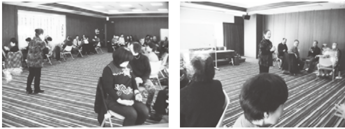
講師を中心に、グループワークをしている様子

個々の問題や悩みを地域の課題として共有し、支援が必要になったときに困らないよう、住民が支え合える地域支援力を向上させるため、研修会を開催しています。 参加した方は、 ①「気づいて」「受け止めて」「つなぐ(行政や関係機関)」ことができ、 ②「交流」を通して「気づいて」「助け合える」関係づくりについて学ぶことができました。 そのような地域を作るため、それぞれの役割を意識しながら、地域活動の活性化につなげていきます。