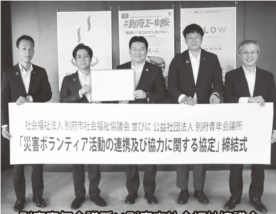
別府青年会議所×別府市社会福祉協議会

今後は平時時から情報の交換を行い、合同研修や訓練を実施し、連携体制を構築していきます。