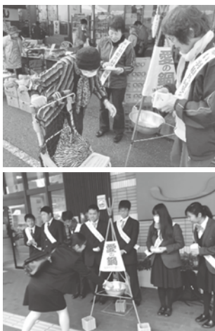
過去の街頭募金の様子

なお、状況次第では中止する場合もございます。日程や最新情報は社協ホームページ上で確認できますので、ご協力よろしくお願ひします。また、赤い羽根共同募金では、12月24日公開の劇場版「呪術廻戦0」とコラボレーションを実施しております。詳しくは本会ホームページをご覧ください。