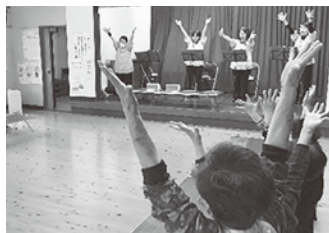
「ふじ山」の演奏に合わせての体操に、歌いながら体操ができるのは楽しいと喜ばれました