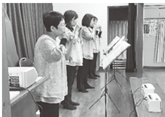
懐かしい童謡や唱歌、流行歌を演奏されました

運営開始から20年以上経過し、現在は年間7回(偶数月・新年会)サロンを開催しています。 10月はオカリナグループ「みずくるま」に演奏をしてもらいました。 『マスクをつけて』『小さな声で』と制約はありましたが、流行歌や唱歌を合唱した参加者は「久しぶりにみんなと歌えた」と喜び、手話コーラスで参加された方もいました。 年間計画は立てますが、皆さんの状況を見ながら計画変更、臨機応変に運営しています。