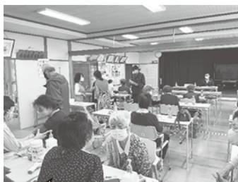
血圧測定後に、健康相談を受けている様子

保健師による参加者の血圧測定や、季節に応じた講話等様々な情報を提供したり、ゲームなどを楽しむ集いの場として、毎月第3金曜日に中島町公民館で開催しています。6月には啓発活動として、駅前交番からおまわりさんに来てもらい、特殊詐欺の電話対応事例をいくつか実演してもらいました。 また、昨年11月から、図書館に行くことを躊躇する高齢者の代わりに自治会が窓口となつて、本の貸出や返却を代行する「本のデリバリー」(宅配)を毎月行っています。サロンでも、本の返却や次回の貸出希望を受けており「笑顔と心」のデリバリーも好評です。毎日の生活の中で、隣近所の助け合い「近助」を台言葉に自治会福祉活動を続けています。