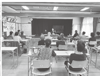
特殊詐欺の電話のやり取りを再現している様子