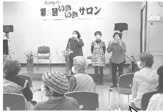
民生委員と福祉協力員2名の方々です