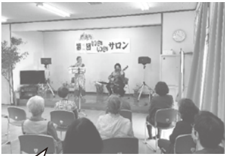
音むすびさんの演奏風景

関の江新町いきいきサロンは、公民館と福祉部の共催で2回、開寿会(老人会)の主催で2回と、今年度2回目のサロンでは、公民館と福祉部の共催で「音むすび」さんによるフルートとクラシックギターの演奏を行い、演奏に合わせ、口ずさむなどして楽しみました。 この日のステージは、公民館長が敷地内のみみじを使って飾りつけたり、民生委員・児童委員と福祉協力員が当日の司会進行を行うなど、アットホームな雰囲気で行われました。 また、事前のチラシ配りで声かけを行いながら受付予約をしますが、一人でも多くの方に楽しんでもらえるよう、当日の飛び込み参加も受け入れています。