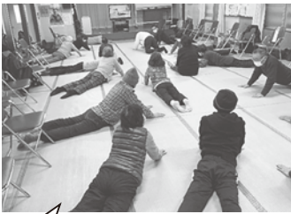
取材日のクールダウン、 極楽ストレッチの様子

「健康寿命を延ばし、地域とのつながりを増やして、安心・安全な老後を過ごす」ことを目的として、平成23年4月から活動をしています。 クラブの名称は、当時の参加者の意見から決まったもので、当初は月1回の開催でしたが、現在は皆さんの希望により月4回、水曜日の10時から1時間、健康体操を中心に交流活動を行っています。 毎回体操の内容を変え、年2回は公民館を離れてウォーキングをするなど、みんな楽しんでいて、クラブの最高齢者は男社とも93歳の方です。 今後とも「引きこもりがちの高齢者の参加拡大と、他地区との交流活動を通して楽しさの増大を図ること」を目標とした活動を続けていきます。