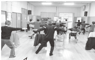
めじろん体操を行って、健康増進!

別府市が主催する健康体操教室で出会った有志により、5年前から扇山公民館で健康体操を中心に活動しています。 月2回ペースで開催しており、参加者は30名前後です。 めじろん体操とゆづり体操を中心に、ゲームや脳トレなどを組み合わせ、参加者に楽しんでいただく会となっています。 今年も、1月と2月に講師を招いてリズム体操の指導を受け、『サザエさん』や『明日があるさ』などの懐かしい曲や流行りの曲を使って体操をしています。 参加者の皆さんは体操だけでなく、みんなと笑って話すことで、体も気持ちも元気になっています。