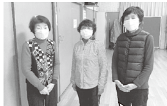
運営スタッフの方です