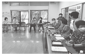
作業後にお茶を飲みながら雑談、ミニ出前講座をしました