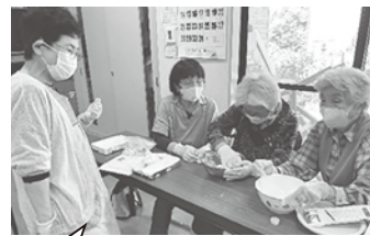
ホウ酸団子を作っている様子

スパランド豊海では、毎月第2、第4火曜日の午後15時～17時、第4火曜日の午後15時～17時にいきいきサロンの開催をしています。もと自治会ができた当初、お茶飲み会として集まったのがきっかけでしたが、現在は皆さんに大変興味がある「健康」をテーマにウォーキングや健康体操を実施してみたり、色々な文化活動にも取り組んでいます。取材に伺った5月は、ホウ酸団子作りを行っており、その他の活動としては、苔玉作り、観劇、日帰りバスツアーなど、参加者がいつ来ても楽しめるよう趣向を凝らした活動を企画しています。