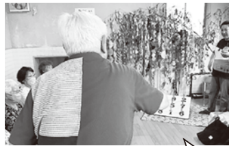
7月には七夕を飾ってゲームなどを楽しみました