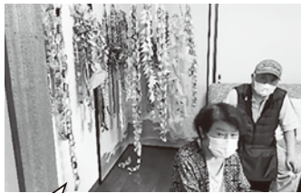
6月はみんなで七夕飾りをつくりました

野口中町では年間2回いきいきサロンを実施してまいりましたが、今年度から野口中町長寿会と一緒にサロン活動を行ないます。 会場は、野口中町公民館1階スペースと地域サロン会場の2ヶ所を交互に活用するようにしています。 取材をした6月は、七夕飾りを地域会場で作り、7月には七夕飾りを切り出した竹に飾りつけ、公民館スペースで別府市老人クラブ連合会で行ったぬりえ表彰者の発表、わなげゲーム大会を行いました。 寒くなれば団子汁の提供などいろいろな計画を立てています。が、まず手始めに長寿会の愛称を決めて息長く続くサロン活動を行ないたいです。