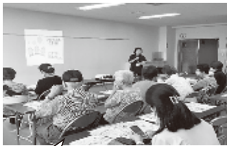
出前講座を受けている様子

秋葉町「高砂会」では15年ほど前から、住民の健康維持のため、体操教室を行っています。回でしたが、参加者の要望で毎回行うようになりました。現在の会場は、センチュリーハイツ日名子3階広場、土曜日の11時から1時間程度で、秋葉町の方ならどなたでも参加できます。 7月には、社協の出前講座「いきいき元気 介護予防」で、フレイル等についての講話を聞いた後も、30分程体操を行いました。 今年も酷暑だったため、8月は2階集会室で開催し熱中症予防に努めるなど、その時の状況に応じた場所で行っています。