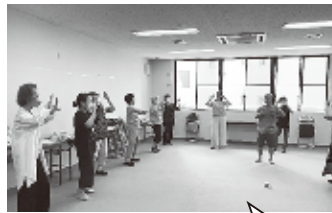
暑さ対策として、集会室で体操をしました