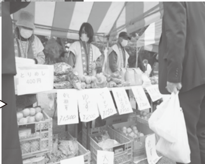
深夜からつくりはじめる とりめしはいつも完売 東山地区