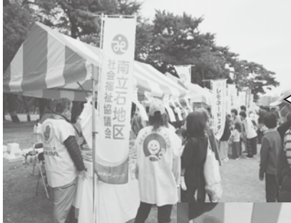
お客さんが順番に吟味 南立石地区

市内17地区社会福祉協議会の方々が、11月に開催された福祉まつりに参加し、店舗やイベントブースで参加者や他出店団体と交流しながら、今年もまつり会場を盛り上げてくれました。