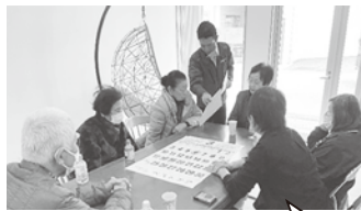
祝日のある月は、日にちを変更するかみんなで話し合って決めています