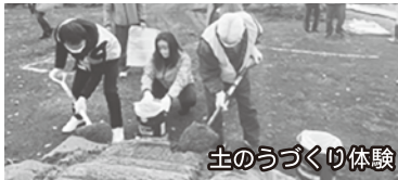
土のうづくり体験