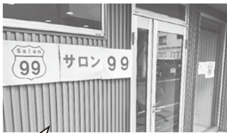
会場は1階のため階段の上り下りの心配はありません

99歳の方の自宅の一部を借りて行われることが『サロン99』の名前の由来です。 開催日は、第1・第3水曜日です。 会場は、通りに面しているため誰もが気軽に立ち寄りやすい場所であり、自分の飲み物は自分でもちよるため気軽におしゃべりを楽しむことができます。 サロン99開設者がお話し手な方で、その方のおしゃべりを中心に、よもやま話で笑いの絶えない会ですが、おしゃべりだけでなく参加者が持ち寄ったゲームを楽しめることもあります。 体験参加はいつでもできますので、気軽にお立ち寄りください。