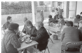
おいしいコーヒーの淹れ方講習を不定期でおこなっています

すえひろコーヒースロンは、町内の方が気軽に立ち寄れる新しい集いの場として、昨年からは毎月第3火曜日の午後、すえひろ広場横の個人の駐車場で開催しています。 地域の人が気楽に参加しやすいサロンとして、就労継続支援B型事業所でフレンドしいおいしいコーヒースロンを100円で飲みながら、通りかかった人も交えて老若男女問わず気軽に語り合っていますので、どなたでも気軽に立ち寄りください。