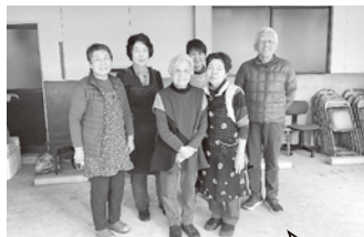
スタッフは自治会長さんや民生委員さん、福祉協力員さんです