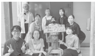
ウェルカムボードでサロン開催をお知らせしています

「石垣東こみゆかふえ」は、地域の誰もが参加できる新たな集いの場として、今年6月にオープンしました。毎月第2土曜日の午後1時半から3時半までの2時間開催しています。小さい子どもさんも参加できるように、レクリエーションも用意しております。レクリエーションも用意して、楽しくしたり、竹を切ったりをみんなで行ったり、竹を切ったり「流しそめん」を楽しんだり、様々な内容を企画しています。 登録なしで誰でも参加できるよ う、時間内のお出立は自由となつていきますので、いつでも遊びに来てください。今後の内容は、参加者の意見も聞きながら決めていく予定です。お知らせは、毎月館に掲示板に配布いたします。是非一度お越しください。