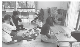
お魚釣りやボードゲームをして遊んでいる様子