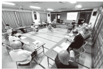
8月サロンで出前講座を受けている様子