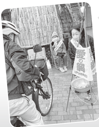
写真は昨年の活動の様子です。