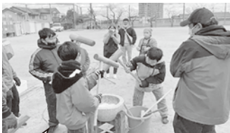
保護者の掛け声でもちつきする子ども達

12月28日(土)に春木川小学校50周年記念として、地区社協と春木川小学校おやじクラブが合同で「三世交代流もちつき大会」を開催しました。雨が降り始め、中絶したため、石垣地区社協からの応援も含め125人の参加となりました。 地区社協、福祉協力員と児童や保護者、学校とが顔の見える関係性作りや、安心して暮らせるまちづくりの一環として、もちつき大会を行いました。 石臼3つと家庭用もちつき機2つを使い大人に混じってもちつきをする子ども達もいれば、見様見真似でもちを丸める幼い子どももいました。参加した地域の女性たちから子どもたちの声や姿を見ると元気をもらおうという声が聞かれました。 これから、地域の人が気楽に話ができる関係性を築くために、さまざまな活動を催していく予定です。