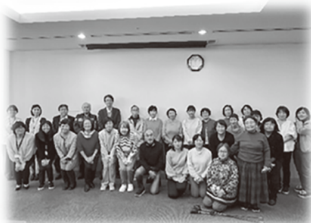
吉野会長ほか参加者の皆さん

視察後は、門司港散策・宇佐神宮へ市民後見活動発展祈願を行ない、会員間の親睦を深めました。