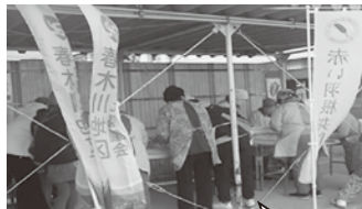
PTAのお母さんと老人会の方を中心にもちを丸めている様子