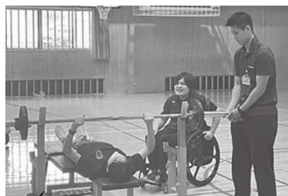
亀川小学校 「パワーリフティング」

令和7年度も引き続き、訪問ワークショップを行いますので、たくさんの申込をお待ちしております。地域福祉係