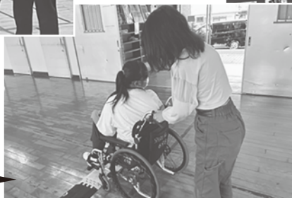
亀川小学校 「車いす体験」