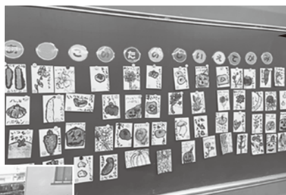
山の手小学校 「絵手紙を書こう」