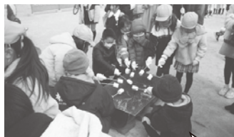
子ども達がマシュマロ 焼きをしている様子