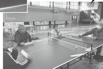
春木川小学校 「卓球バレー」