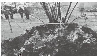
どんどの火は勢いよく燃えて、 年神さまをみんなで見送りました

1月11日、地域住民や多くの子ど も達が見守る中、朝日小学校の運動 場で、正月行事の「どんど焼き」を 実施しました。朝日地区の「どんど 焼き」は、火売神社の奏上のおのち、 参加者が自宅から持ち寄った松飾や しめ縄、書初めなどを燃やすことで、 五穀豊穡や家内安全を願うと共に年 神さまを見送る火祭りです。