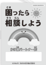
オリジナルステッカー

地域(お客様)の困りごと・心配ごとを別府市社協へ繋ぐかけ橋となれるお店 ※繋いでいただいた相談は専門機関と連携しながら解決へ向け支援します。