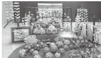
みんなが持ち寄った雛飾り、 毎年増えてます