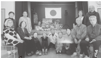
雛飾りを中心に 記念撮影をしました

小坂ひまわり会は、今月創立61年目を迎え、「みんなであそびながら健康になりましょう」をスローガンに活動しています。 主な活動日は、土曜日と金曜日です。毎月第1土曜日は、定例会と季節行事、2週目以降は体操やカラオケなど、毎月第2金曜日は卓球ハレーを13時30分から小坂公民館で行っています。 3月は、参加者のハーモニカにあわせて歌ったりしてひな祭りを楽しみ、今は、6月に亀川地区で行われる「ふれあいスポーツ大会」での卓球ハレー優勝を目指して、今後も、楽しく、元気に活動を続けていきます。