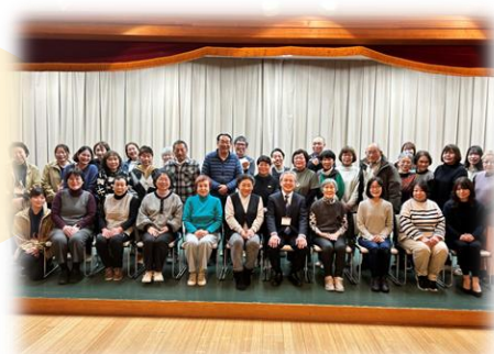
ステップアップ講座 修了式にて