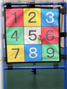
1番人気のストラックアウト

別府市社協ではボランティア活動でも使えるレクリエーション用品の貸し出しも行っていきます。今回は一番人気のストラックアウトを紹介します。